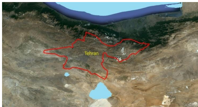
شکل (۱): موقعیت جغرافیایی شهر تهران. Figure 1: The Location of Tehran city.

برای نمونه برداری از آب بارش دو ایستگاه هم دیدی اقدسیه و مهرآباد سازمان هواشناسی و برای مطالعه خردفیزیک ابر پنج منطقه اقدسیه، دانشگاه علوم و تحقیقات تهران، موسسه ژئوفیزیک دانشگاه تهران، مهرآباد و دوشان تپه انتخاب شده اند. در جدول (۲) طول و عرض جغرافیایی مکان‌های انتخاب شده نوشته شده است.