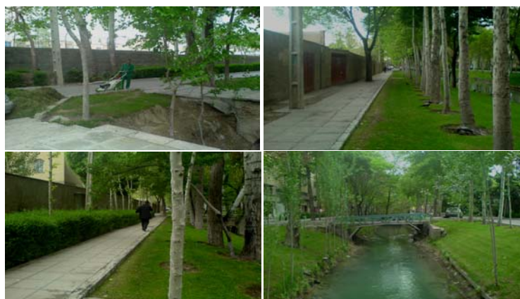
تصویر ۸- نمونه هایی از طرح اجرا شده در حاشیه مادی نیاصرم