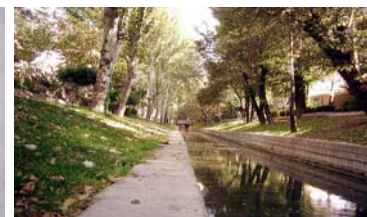
تصویر ۱- تصاویری از مادی نیاصرم؛ زیباترین و پرآب‌ترین مادی شهر اصفهان