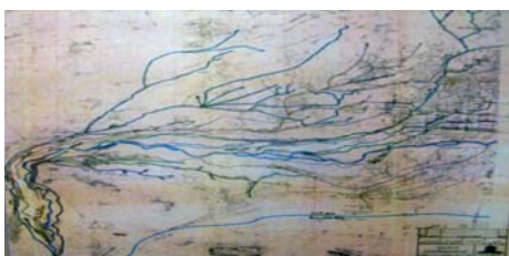
تصویر ۳- نحوه حرکت مادی‌ها در شهر؛ مادی‌ها چون شریان‌های حیات‌بخش در سطح شهر اصفهان پراکنده شده‌اند. مأخذ: دفتر برنامه‌ریزی و تألیف کتابهای درسی، ۱۳۸۳، ص ۲۰