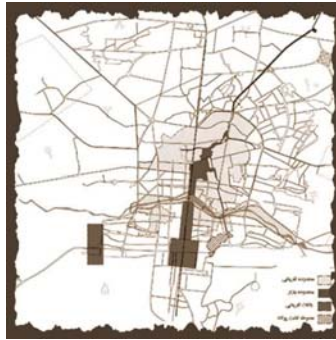
تصویر ۵- تأثیر زاینده رود و انشعابات آن بر بافت شهر اصفهان

اغلب مادی‌ها با عبور از بافت تاریخی شهر اصفهان ضمن تأثیری که بر بافت و محدوده اطراف خود گذاشته‌اند، از ویژگی‌های کالبدی، تاریخی و اجتماعی محل عبور خود تأثیر پذیرفته‌اند. به طوری که یک مادی با گذر از محله‌های مختلف که ویژگی‌های اجتماعی و فرهنگی متفاوتی داشته در هر قسمت رنگ و طرح ویژه‌ای را در بدنه خود نمایان ساخته است (تصویر شماره ۵).