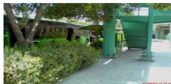
تصویر ۹- پاره ای از اقدامات صورت گرفته در چشمه باقرخان: نصب تابلو، استقرار ایستگاه اتوبوس، اصلاح شیب جانبی