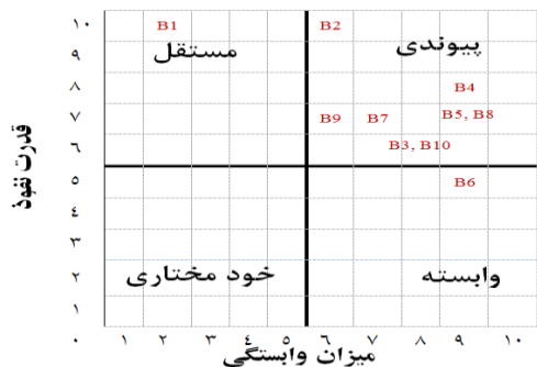
شکل ۳- نمودار تحلیل وضعیت شاخص‌های ایجاد کننده استرس در حرفه حسابرسی