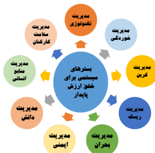
شکل ۲- بسترهای سیستمی برای خلق ارزش پایدار در پتروشیمی مروارید

در حال حاضر ۹ سیستم مدیریتی به شرح شکل شماره (۲) در پتروشیمی مروارید در دست اقدام (از طراحی تا استقرار) هستند که ارائه مفصل آنها از حوصله این مقاله خارج است.