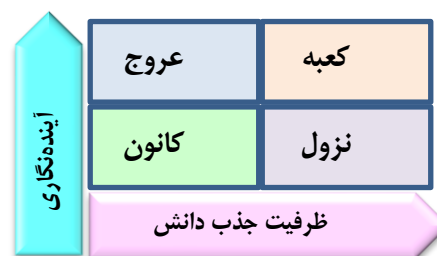
نگاره (۴): سناریوهای محتمل با ترکیب قابلیت های ظرفیت جذب

هدف این مقاله پاسخ به این سؤال می باشد که سناریوهای محتمل آینده صنعت بانکداری ایران با ترکیب قابلیت های ظرفیت جذب دانش و آینده نگاری شرکتی چیست؟ تصویر آینده صنعت بانکداری در دو وضعیت ظرفیت جذب دانش و آینده نگاری شرکتی پایین (کانون آلام) و بالا (کعبه آلام) چگونه خواهد بود؟ در ادامه می توان با ترکیب دو قابلیت ظرفیت جذب دانش و آینده نگاری شرکتی چهار حالت و سناریو برای آینده بانکداری ایران را ترسیم نمود (نگاره ۴).