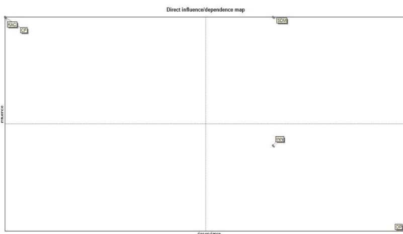
نگاره (۲): نقشه اثرگذاری/ اثرپذیری مستقیم ابعاد مدل

در ادامه با هدف، شناسایی اثرگذاری ابعاد اصلی مدل بر یکدیگر از نرم‌افزار میک استفاده شد. همان‌طور که در نگاره (۲) ملاحظه می‌شود، ابعاد ظرفیت جذب دانش و آینده‌نگاری