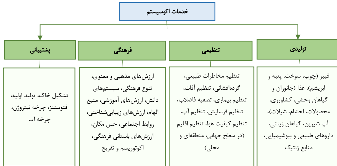
شکل ۱- طبقه‌بندی خدمات اکوسیستم بر اساس گزارش ارزیابی اکوسیستم هزاره (۱۸)

پس‌زمینه‌ای هستند که افراد مستقیماً از آن استفاده نمی‌کنند و برای نگهداری سایر خدمات هستند (۵ و ۱۹). ارزیابی اکوسیستم هزاره هر کدام از چهار طبقه مذکور را به زیرمجموعه‌های مختلف تقسیم‌بندی کردند و جایگاه رواناب و فرسایش در دسته خدمات