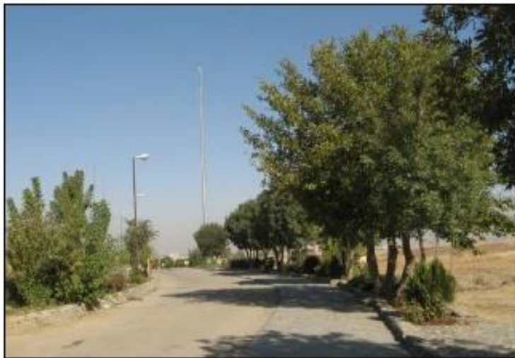
شکل ۲: قسمتی از مسیر بازدید کنونی منطبق بر گذرهای تاریخی