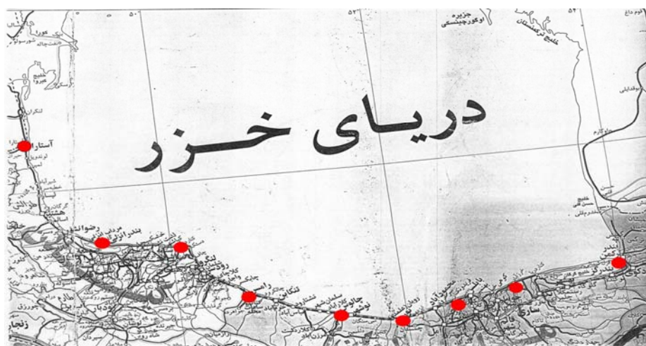
شکل ۱- ایستگاه های نمونه برداری در سواحل جنوبی دریای خزر

دریاچه خزر بزرگ ترین دریاچه جهان بوده و ۴۰٪ آب های دریاچه ای جهان را در خود جای داده است. این دریاچه از شمال به جنوب کشیده شده است. در حدود ۱۳۰ رودخانه به این دریاچه می ریزند که رودخانه ولگا مهم ترین رودخانه ای است که به آن منتهی می شود و ۸۰٪ آب آن را تامین می کند. کورا و اورال نیز به ترتیب ۶٪ و ۵٪ آب ورودی به دریاچه خزر را تشکیل می دهند (۲ و ۱). این رودخانه ها حامل سموم ارگانوکلره فراوانی هستند (۳). این دریاچه توسط پنج کشور ایران، روسیه، آذربایجان، قزاقستان و ترکمنستان احاطه شده است (۴). امروزه دریاچه خزر دچار بحران های زیست محیطی از جمله آلودگی های سموم ارگانوکلره، نفتی و ... می باشد. بنابراین شناخت ویژگی های زیست محیطی، منابع حساس بیوفیزیکی و کانون های آلوده ساز از سوی کشورهای ساحلی آن می تواند راهکاری مناسب در جهت کنترل و پیشگیری هر گونه بحران زیست محیطی را فراهم سازد. به دلیل محصور بودن دریاچه خزر، آلودگی هایی که در آن تخلیه می شوند، بعد از حرکت در سطوح آب، ته نشین شده و غالباً جذب رسوبات می گردند. تولیدات نفتی و همین طور پساب های شرکت های ساحلی که به دریا وارد می شوند، از منابع مهم آلوده کننده این دریا می باشند (۵). از این رو در این پروژه سموم ارگانوکلره لیندان، آلدین، دیلدین، هپتاکلر و ددت